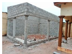
la future boulangerie

Actuellement, grâce au soutien de nos paroissiens, une future boulangerie est en cours de construction. L'abbé Antoine projette d'y installer un four et d'engager un boulanger professionnel pour former les filles à ce métier.