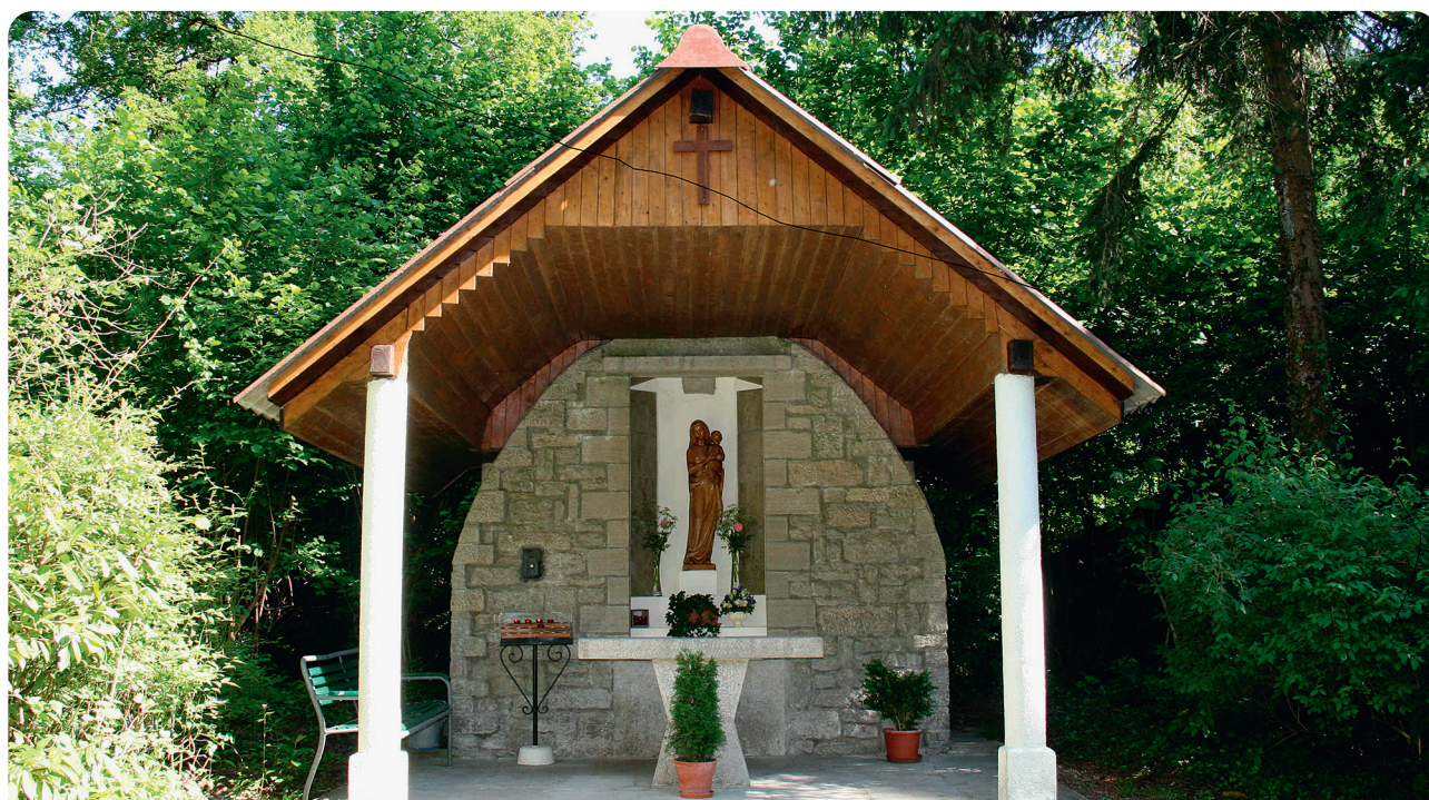
Oratoire de N-Dame des Mâs à Bollion