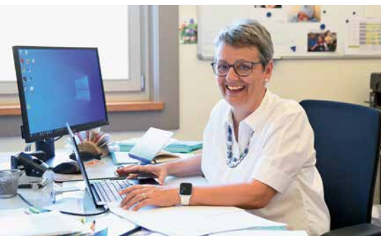
La nouvelle déléguée épiscopale dans son bureau du Vicariat à Fribourg.