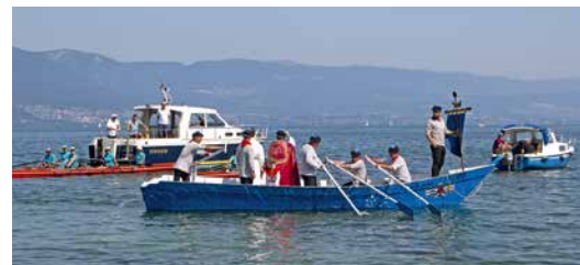
La bénédiction des bateaux par l'abbé Lukasz, depuis la barque de la confrérie.

Grand moment de l'année pastorale, la patronale de Saint-Laurent, accompagnée de la bénédiction des barques des pêcheurs, n'a pas connu cette année son faste habituel. Covid oblige, la messe en plein air, sur une estrade, à la place Nova Friburgo, a été annulée par mesure de précaution sanitaire. Même sort pour les réjouissances partagées autour d'une bonne friture avec les pêcheurs. Dommage bien sûr, ce d'autant que l'espace au bord du lac est vaste.