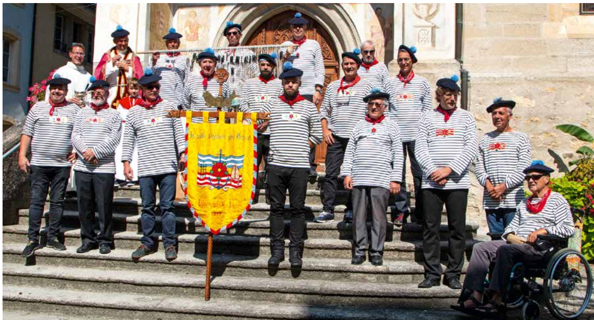
Les membres de la Confrérie des pêcheurs posent à la sortie de la messe devant la collégiale.

PAR CLAUDE JENNY