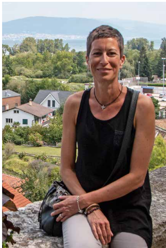
... et désormais aussi agente pastorale.