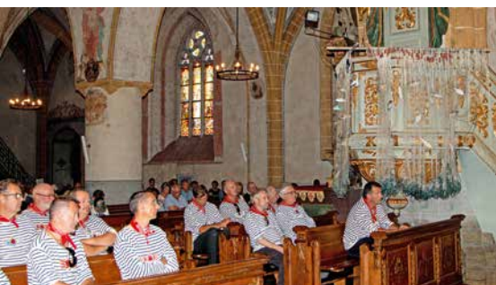
Durant la messe célébrée non pas en plein air mais à la collégiale.